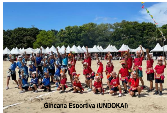
Gincana Esportiva (UNDOKAI)