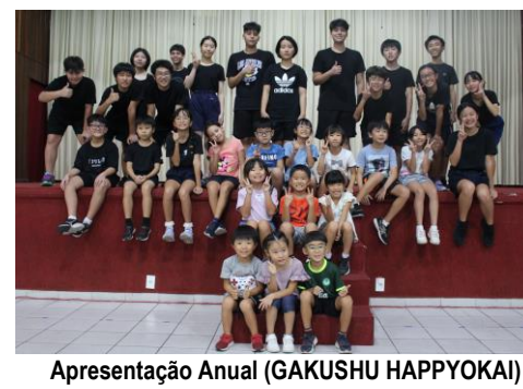
Apresentação Anual (GAKUSHU HAPPYOKAI)