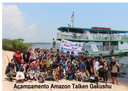
Acampamento Amazon Taiken Gakushu

※日本文化コース入学を希望する児童・生徒が円滑に学校生活を送れるようにするため、会話集「がっこうでつかうにほんご」(1冊 R$5,00)を用意しました。ご利用の方は、日本人学校にてお求めください。Elaboramos um livreto de conversação da “Língua Japonesa usada na escola” (no valor de R$5,00), para que os alunos interessados em ingressar no Nihon Bunka Course possam se adaptar ao ambiente escolar da melhor forma possível.